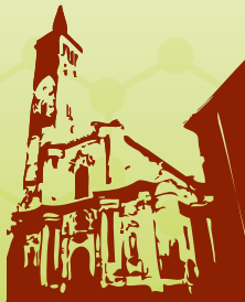
Basilica di S. Martino (Treviglio)