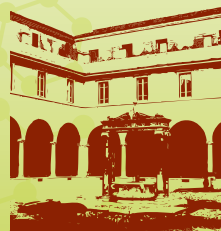
Basilica di S. Martino (Alzano Lombardo)