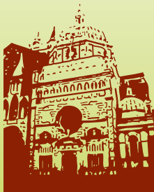
Basilica di S. Maria Maggiore (Bergamo)