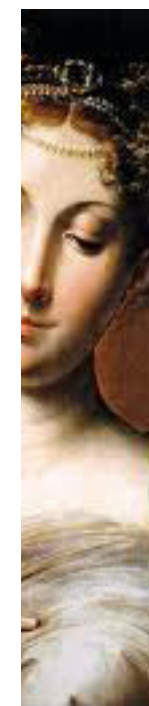
Immagine: "Madonna dal collo lungo" del Parmigianino