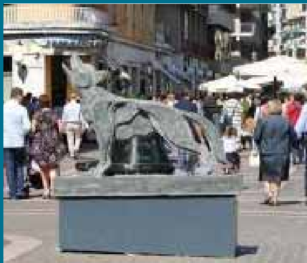
Mimmo Rotella Il lupo della Sila