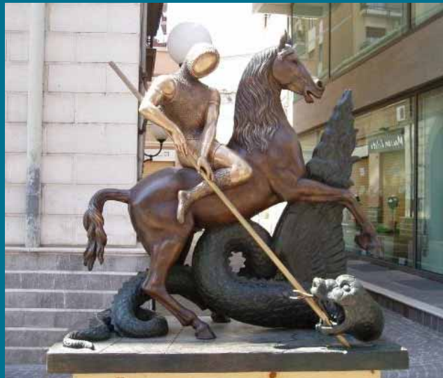
Salvador Dali San Giorgio e il drago