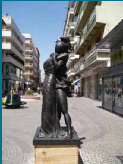
Giorgio De Chirico Ettore e Andromaca