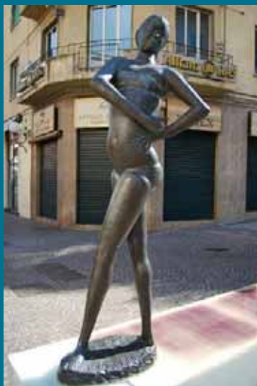
Emilio Greco Grande bagnante 2